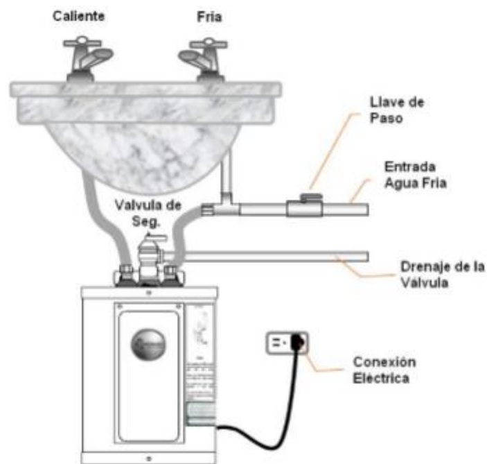
Figura N° 2 Conexión al Sistema de Agua

Se recomienda seguir las siguientes instrucciones antes de realizar la conexión del agua: